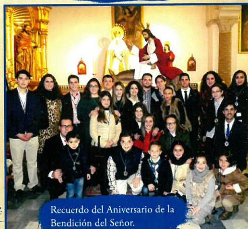
Recuerdo del Aniversario de la Bendición del Señor.