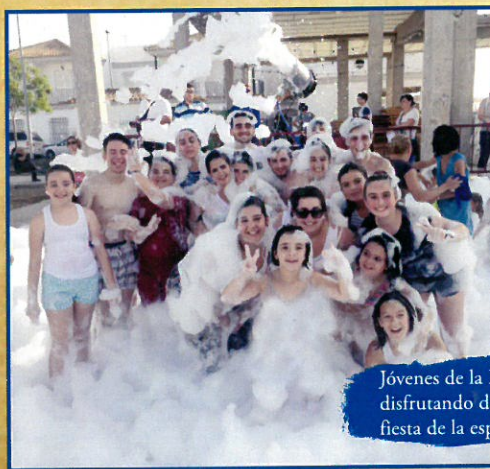
Jóvenes de la Hermandad disfrutando de la verbena en la fiesta de la espuma.