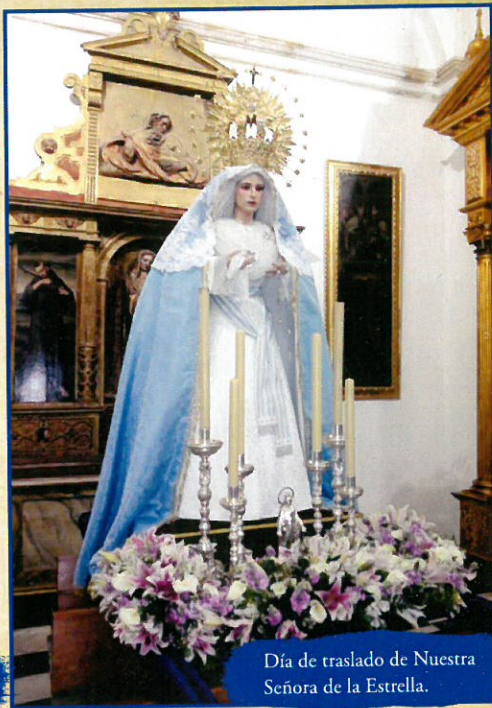
Día de traslado de Nuestra Señora de la Estrella.