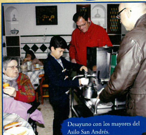
Desayuno con los mayores del Asilo San Andrés.