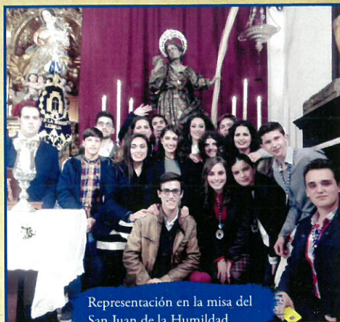
Representación en la misa del San Juan de la Humildad.