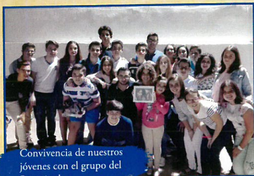
Convivencia de nuestros jóvenes con el grupo del Resucitado.