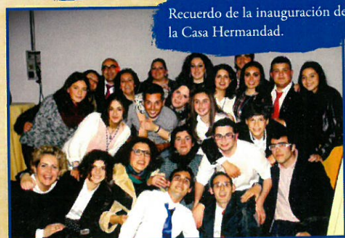
Recuerdo de la inauguración de la Casa Hermandad.