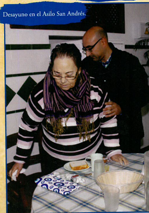
Desayuno en el Asilo San Andrés.