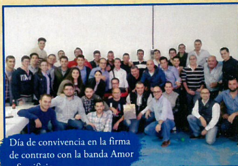
Día de convivencia en la firma de contrato con la banda Amor y Sacrificio.