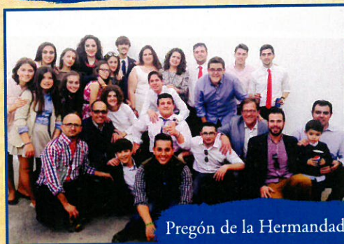
Pregón de la Hermandad.