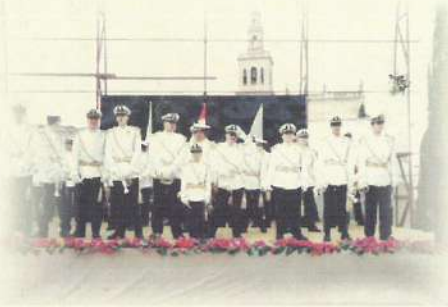
Banda de La Borriquita año 1997