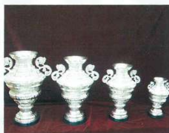
Juegos de varas presidencia