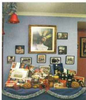
Rifa cesta de navidad a beneficio de caritas parroquiales