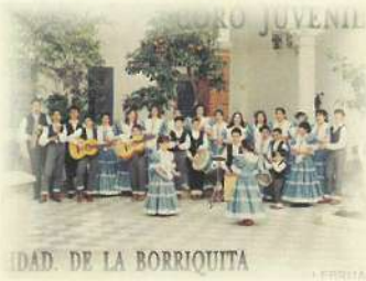
Coro juvenil año 1994