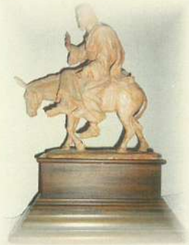
1º Boceto en barro año 1989