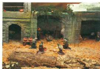
Belén en Casa Hermandad