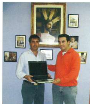
Entrega de rifa del ordenador