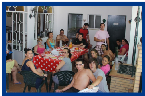
Convivencia en el Rocío