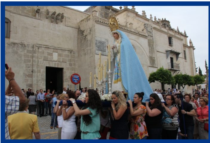
Traslado de Ntra. Sra. de la Estrella

Para el 2.013, la intención de la junta de gobiernos es continuar con la misma línea de trabajo en los eventos y cultos que hemos mencionado anteriormente. Aunque estamos planteándonos trabajar más en la integración e implicación de un número mayor de hermanos en todos los actos de nuestra hermandad.